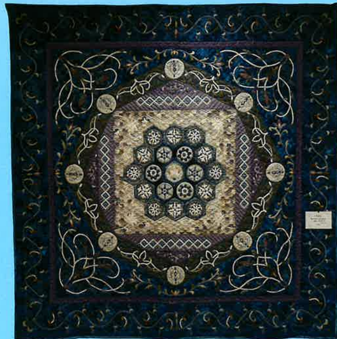
「八角縁起」(fortune octagon) 200×200