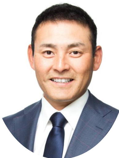
野球評論家 川上憲伸